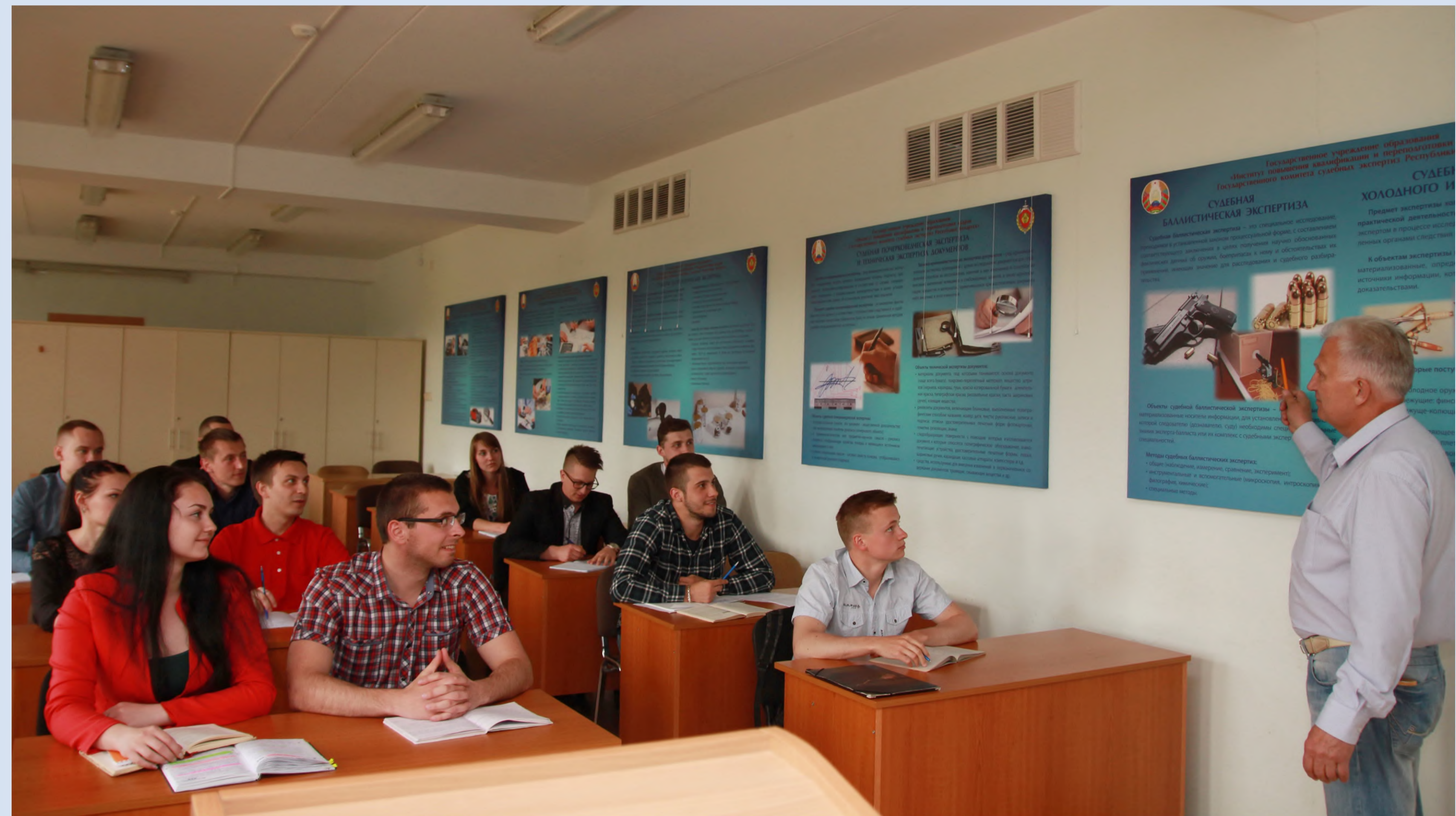
Специальности переподготовки кадров на уровне высшего образования, реализуемые в Институте